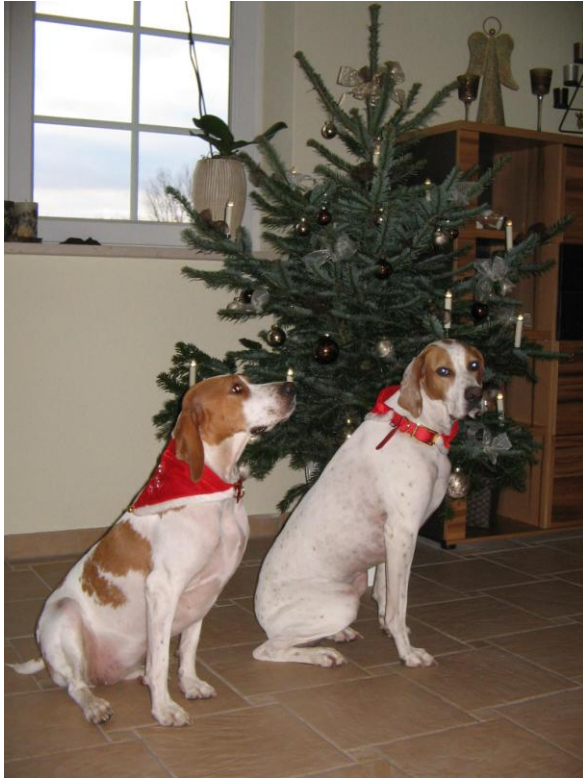
... 2011: Unser erstes Weihnachten zu Viert ...

Vielen Dank für Eure wundervolle Arbeit, ohne die unsere Tana-Maus jetzt wohl nicht mehr am Leben wäre! Herzlichen Dank dafür!